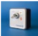
Sélecteur Rotatif avec clef

(*) Voir caractéristiques techniques détaillées sur les fiches produit.