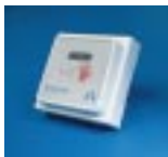
Détecteur de proximité