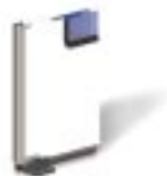
Vantail en aluminium laqué blanc Ral 9010