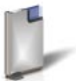
Acier inoxydable ATSI 304 ou 316