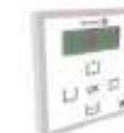
Sélecteur Óptima+ Sélectionneur pour le contrôle de la porte automatique.